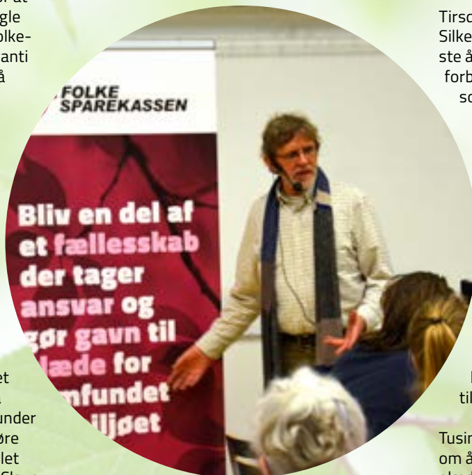
Søren Ryge Petersen - som de fleste kender fra tv og som forfatter - gæstede årsmødet i Aarhus og fortalte om uforglemmelige oplevelser fra sin egen barndom og fra de mennesker, han gennem tiden har interviewet.

ressant foredrag om, hvordan mursten fra sanerede bygninger kan renses og genbruges i nye, moderne byggerier. På den måde har virksomheden skabt en rigtig god forretning indenfor cirkulær økonomi og sparer årligt miljøet for tonsvis af CO 2 .