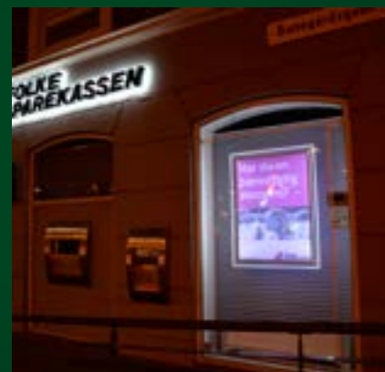
Både facadeskilt og vinduesplakater er belyst med LED i Folkesparekassen på Frederiks Allé i Aarhus.